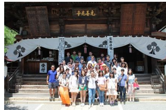
フィールドワーク (日本探訪旅行)