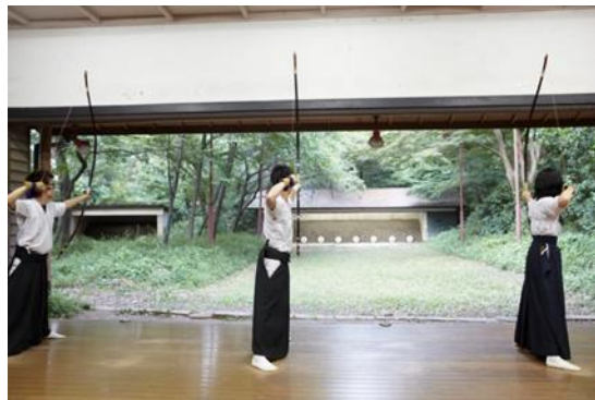
クラブ活動：弓道部にて