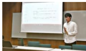
修了レポート発表会