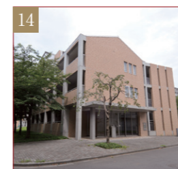
小平国際ゲストハウス