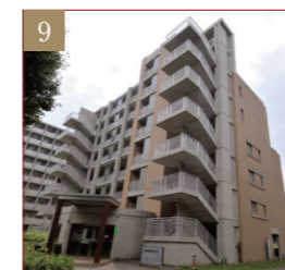
一橋寮D棟(夫婦・家族棟)