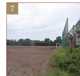
アメフト場・野球場・サッカー場