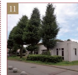
課外活動共用施設