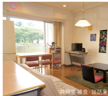
共用室 補食・談話室