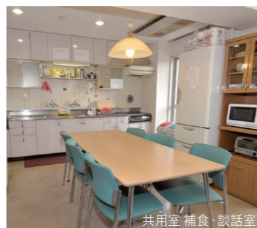
共用室 補食・談話室