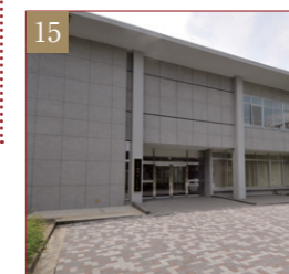
小平研究保存図書館