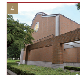
如水スポーツプラザ