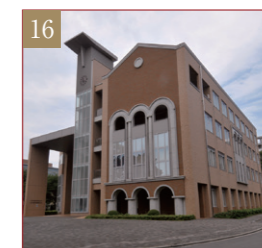
国際共同研究センター