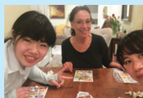
ホームステイで多種多様なアメリカの家庭を体験し異文化に触れる!