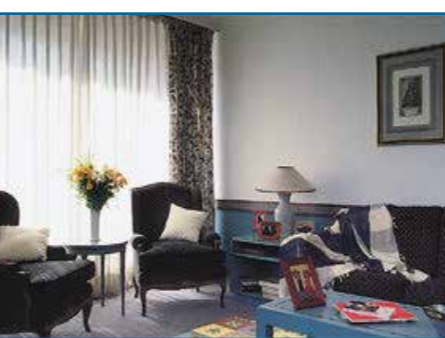
▲参加者が滞在する Weekly マンション（例）