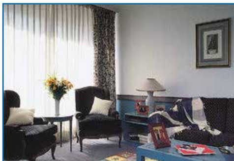
▲参加者が滞在する Weekly マンション(例)