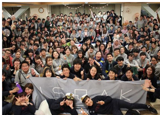
国際学生宿舎で行われた ウェルカムパーティー