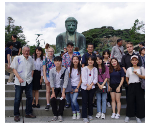
フィールドワーク (鎌倉ツアー)

日本語・日本文化研修留学生データベースに修了者の連絡先等を蓄積し、ネットワーク構築を図っています。また、コース修了後でも、成績証明書等の発行が可能です。