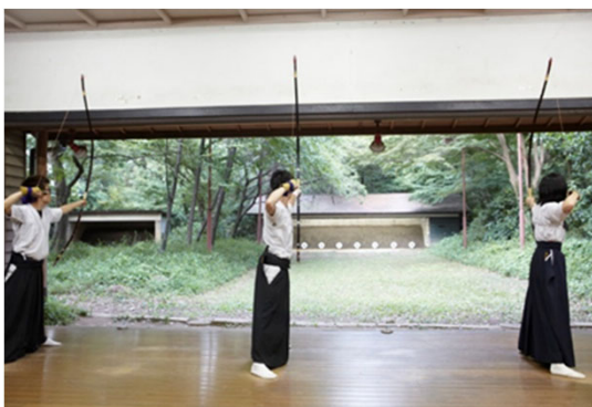
クラブ活動：弓道部にて