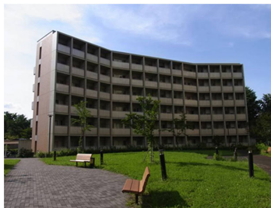
一橋大学国際学生宿舎